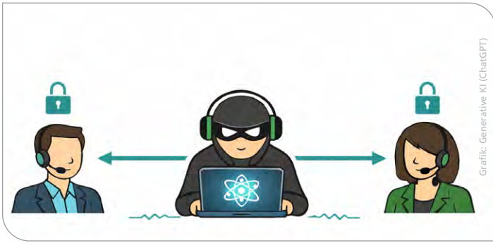
Sichere Kommunikation in Gefahr: Ein leistungsstarker Angreifer versucht, die Kommunikationsverbindung abzuhören.

Licht-Materie-Wechselwirkung, indem er Photonen auf ultrakleine